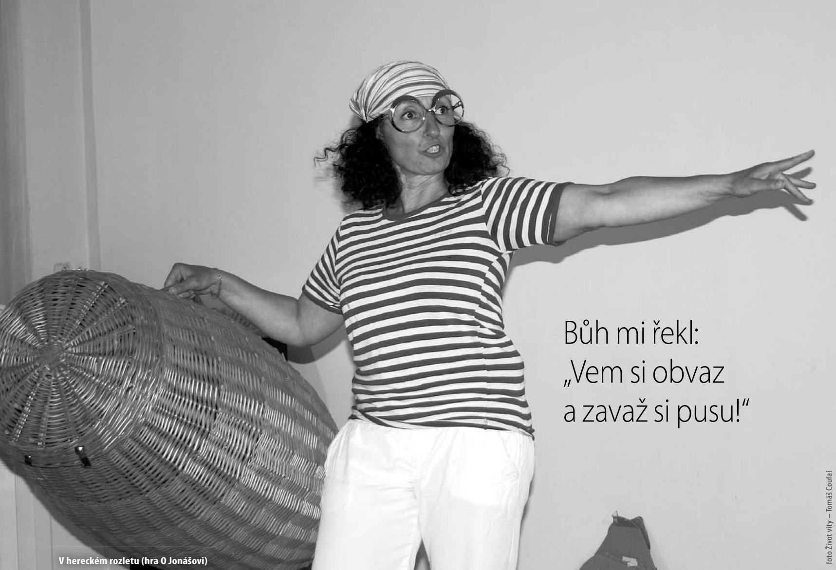
V hereckém rozletu (hra O Jonášovi)